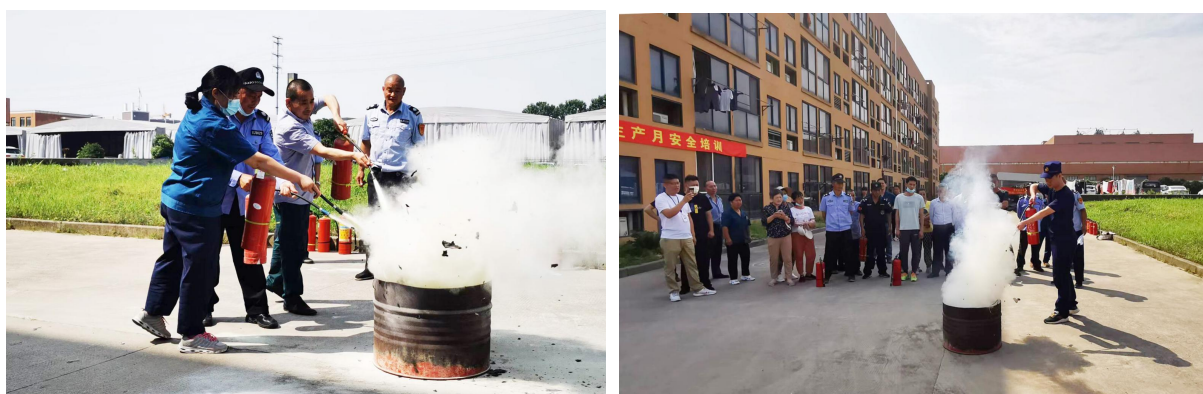
图 6.3-01 2022 年火灾应急演练记录