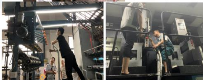
图 3.2-1 培训活动案例

根据公司教育培训方案对全体员工进行了质量诚信和质量意识方面的教育培训，做到有计划，有安排，有检查，有考核，有总结，确保了培训效果和质量。